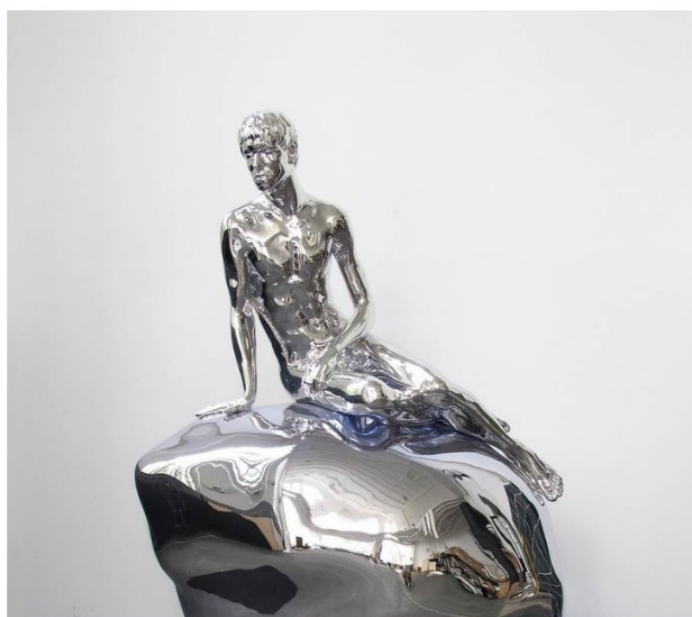
ELMGREEN & DRAGSET, "He", 2013