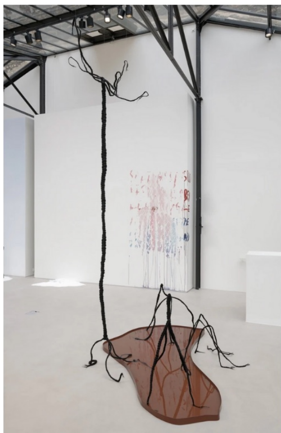
BINTA DIAW, "NAÎTRE AU MONDE, C'EST CONCEVOIR (VIVRE) ENFIN LE MONDE COMME RELATION #6", 2023