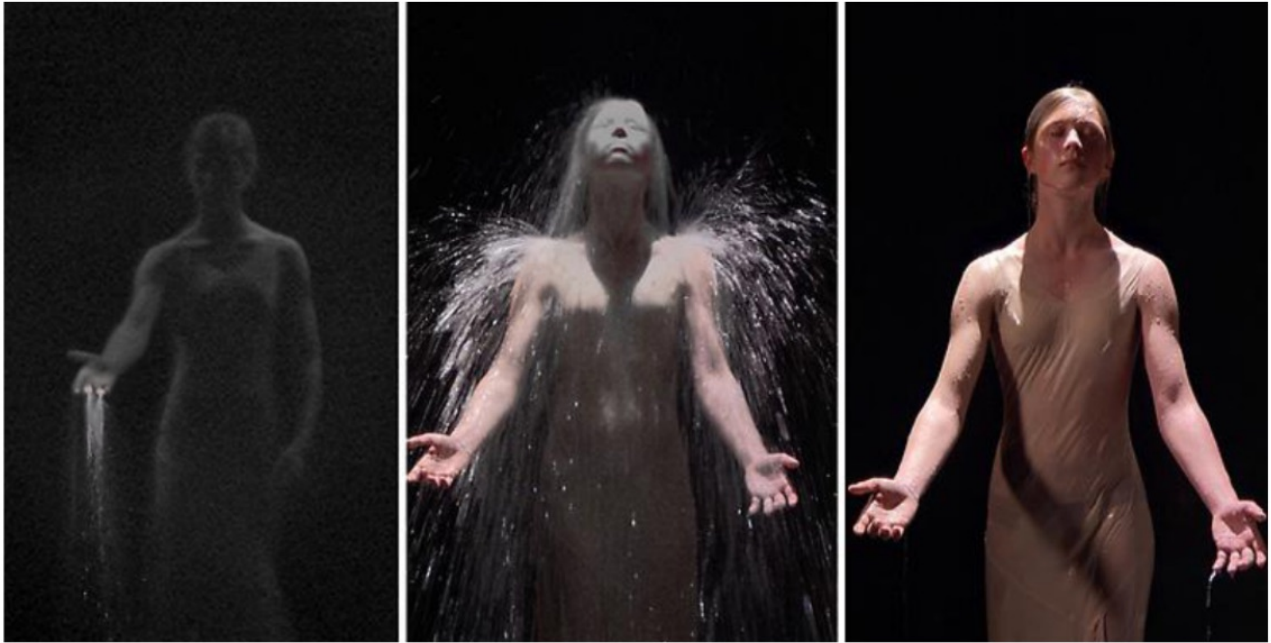
BILL VIOLA, "ANIKA (STUDY FOR OCEAN WITHOUT A SHORE)", 2008