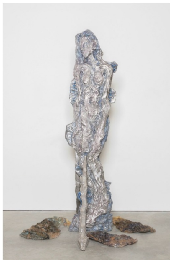
J-M. APPRIOU, "NAÏAD" (OYSTER), 2018