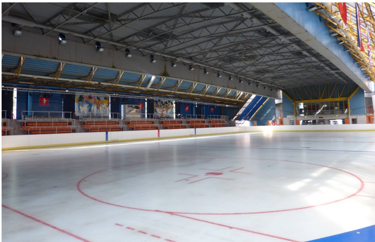
PHOTO DE LA PATINOIRE DE SAINT-OUEN