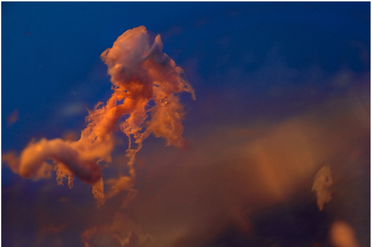
FABIEN LÉAUSTIC, "GENÈSE D'UN PAYSAGE MÉDUSÉ", 2020

DU 15 OCTOBRE AU 19 NOVEMBRE 2023, PATINOIRE DE SAINT-OUEN ÉVÈNEMENT PARIS+ ART BASEL