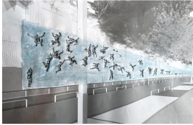
Euphoria d'Ugo SCHIAVI ® Droits réservés

Porté par cette ambition, Ugo SCHIAVI s'appuiera sur les histoires vécues des gens qu'il rencontrera pour fabriquer ces saynètes . Pour ancrer son projet dans le territoire, le bas-relief sera également réalisé par moulage sur les corps des habitants et des acteurs de la vie locale qui souhaitent participer à ce projet. Un appel à participation sera envoyé afin de réunir une trentaine de personnes volontaires qui se réuniront à l'atelier Nawak et Ventilo , implanté depuis longtemps à Saint-Denis. Etudiants des établissements du quartier, ouvriers du chantier, futurs employés du Village... La diversité des profils sera privilégiée pour immortaliser habitants et acteurs du Village et en faire les sujets principaux de l'œuvre.